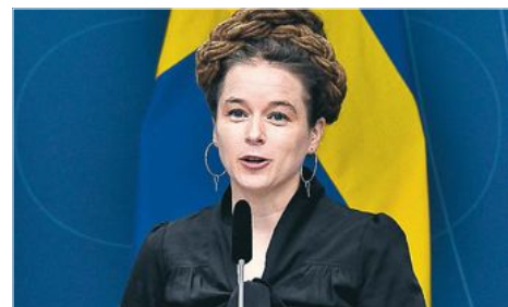
Kulturminister Amanda Lind (MP).